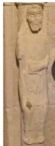
Imagenes 3.0 y 3.1