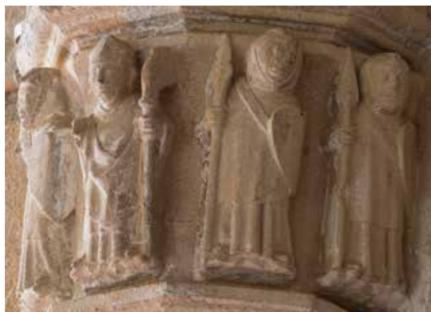
El obispo va con sus tropas y sabemos que pelea como uno más en la batalla. Image 3

Son 5 los capiteles conservados sobre el tema: